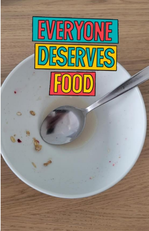
Thema Armut „Everyone deserves food“