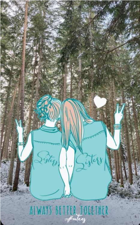
Thema Reichtum „Sisterhood“